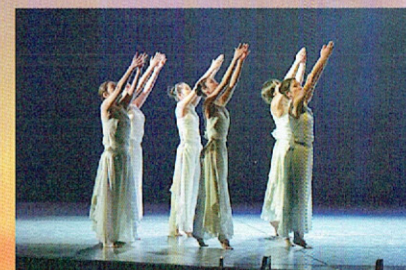
島田恵舞踊研究所