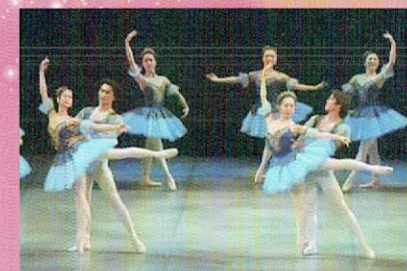
川島ナナバレエ団