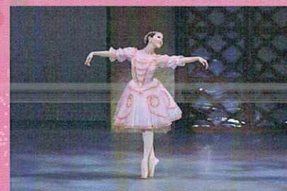
今井クラシックバレエスクール