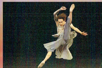
かやの木芸術舞踊学園

2.8(土) 14:30 開場 15:00 開演 ぎふ清流文化プラザ 長良川ホール (岐阜市学園町 3-42)